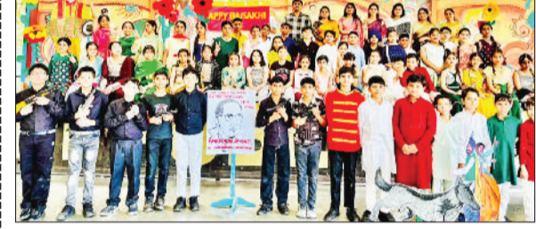
बहादुरगढ़। कार्यक्रम में प्रस्तुति देने वाले डीपीएस के विद्यार्थी।