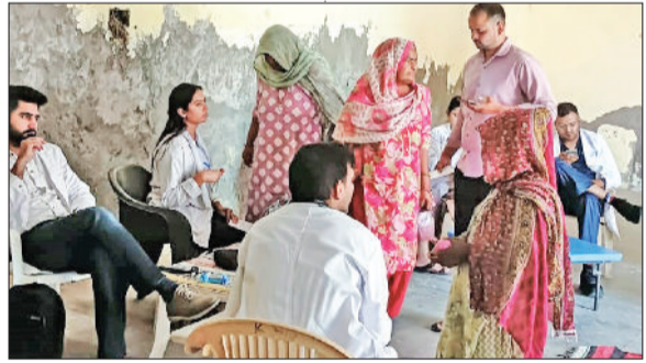
झज्जर। शिविर में अपनी स्वास्थ्य जांच कराने पहुंचे ग्रामीण।

समाधान शिविर में की पेयजल की शिकायत झज्जर। सोमवार को लघु सचिवालय स्थित सभागार में आयोजित समाधान शिविर में एडीसी जगनिवास ने नागरिकों की समस्याएं सुनीं और संबंधित अधिकारियों को अविलंब समाधान के निर्देश दिए। समाधान शिविर में नागरिकों ने पेयजल आपूर्ति, सीवेज सिस्टम दुरुस्त करवाना, नई पाइप लाइन बिछवाने, परिवार की आय दुरुस्त करवाने, बीपीएल कार्ड, अवेध कब्जे हटवाने बारे एवं विभिन्न सामाजिक पेंशन बनवाने से संबंधित शिकायतें रखीं। इस दौरान जिला स्तरीय समाधान शिविर में सात शिकायतें दर्ज की गईं।