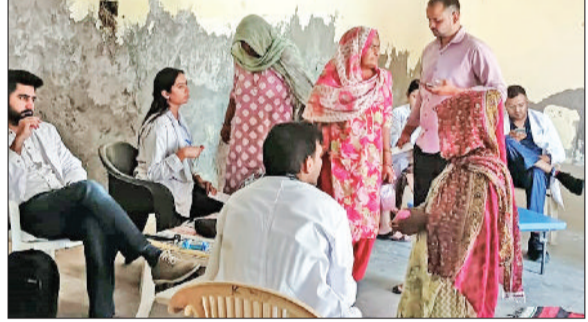
झज्जर। शिविर में अपनी स्वास्थ्य जांच कराने पहुंचे ग्रामीण।