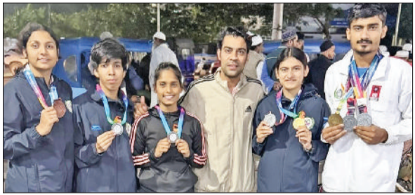
बहादुरगढ़। कोच के साथ विजेता खिलाड़ी।