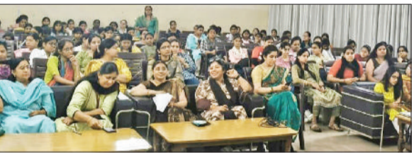
बहादुरगढ़। कार्यक्रम के दौरान उपस्थित छात्राएं, प्रिंसिपल व स्टाफ।

सोमवार को वैश्य आर्य कन्या महाविद्यालय में रिमोट सेंसिंग, जीआईएस एवं इंटरनेट पर एक सेमिनार का आयोजन किया गया। इसमें छात्राओं को आधुनिक तकनीकों एवं कॅरियर के नए अवसरों की जानकारी दी गई।