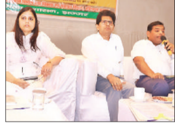
झंझर। नेहरू कॉलेज में झूँ प्रक्रिया में भाग लेते उपस्थित अधिकारी।