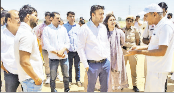
बहादुरगढ़। एसडीएम के समक्ष अपना पक्ष रखते प्रभावित लोग।