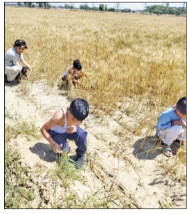
झज्जर। खेत में दरती से फसल कटाई सीखते हुए विद्यार्थी।