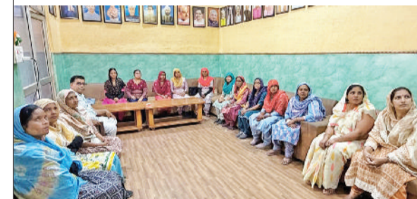
बहादुरगढ़। पीएम के कार्यक्रम को देखतीं चेयरपर्सन व अन्य महिलाएं।