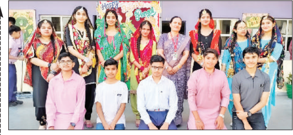
बहादुरगढ़। बैसाखी पर प्रस्तुति देते फाउंडेशन स्कूल के विद्यार्थी।